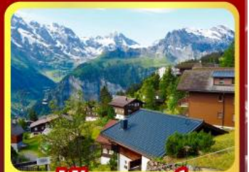
หมู่บ้านเมอร์สเรน