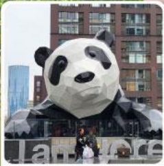
แพนด้าปิ่นตึก IFS