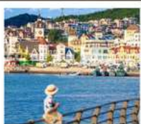
อ่าวหลิงเจียว