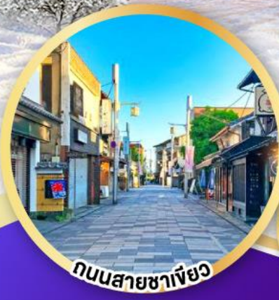
ถนนสายซาซายะ