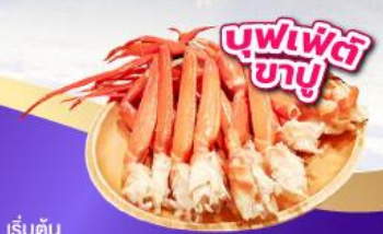
บุฟเฟ่ต์ ซาซุ