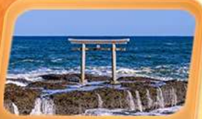
ศาลเจ้าโออาไรโอโซซากิ

ชมภาพใกล้ชิด "ฟูจิซัง" ที่หมู่บ้านโอชิโนะ อักโท สวนโออิชิปาร์ค ที่เที่ยวนั่งรถเช่าชมวิวภูเขาสิคะ ศาลเจ้าโออาไรโอโซซากิ ศาลเจ้าโทริอิริมทะเล อนุสาวรีย์โอบิโนะเปสึนชิ น้ำตกเคดอน ศาลเจ้านิกโกโทโย เซรินมงคล วัดพระใหญ่อุซึคุ ไคบุคชิ หามพลาดคอมแดงยักษ์ วัดอาซากุสะ อิมอร้อยตลาดปลาโทโยสุ ทักทายแมว 3D ย่านชิจูกุ ซ้อมบึงจูงใจย่านดังชิบูย่า