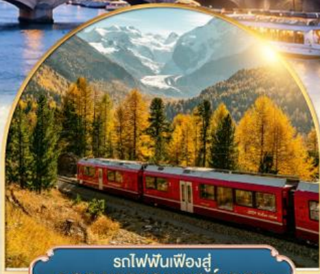
รถไฟฟันเฟืองสู่ยอดเขากรอนเนอส์เกรต