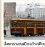
นั่งรถรางในเมืองต้าเหลียน