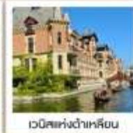
เวนิสแห่งต้าเหลียน