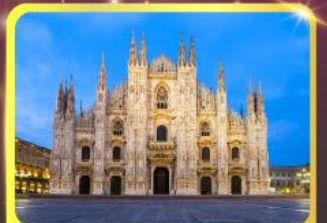
มหาวิหารแห่งเมืองมิลาน