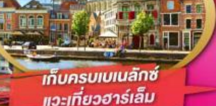
เก็บครบเบเนลักซ์ แวะเที่ยวฮาร์เลม