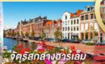
จัตุรัสกลางฮาร์เลม