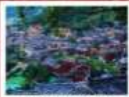
หมู่บ้านแม่วชิเจียง