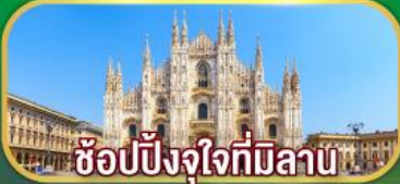
ซ็อบบิงจู่ใจที่มิลาน

เดินทาง 07-14 เม.ย. 69 / 02-09 พ.ค. 69 27 พ.ค. - 03 มิ.ย. 69 / 17-24 มิ.ย. 69 22-29 ก.ค. 69 / 11-18 ส.ค. 69 16-23 ก.ย. 69