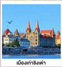
เมืองท่าชิงเต่า