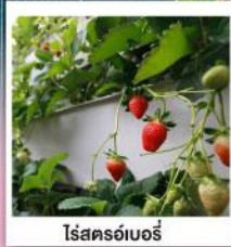
โรสตรอว์เบอร์รี่