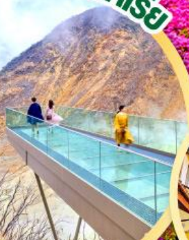
OWAKUDANI EARTH VALLEY