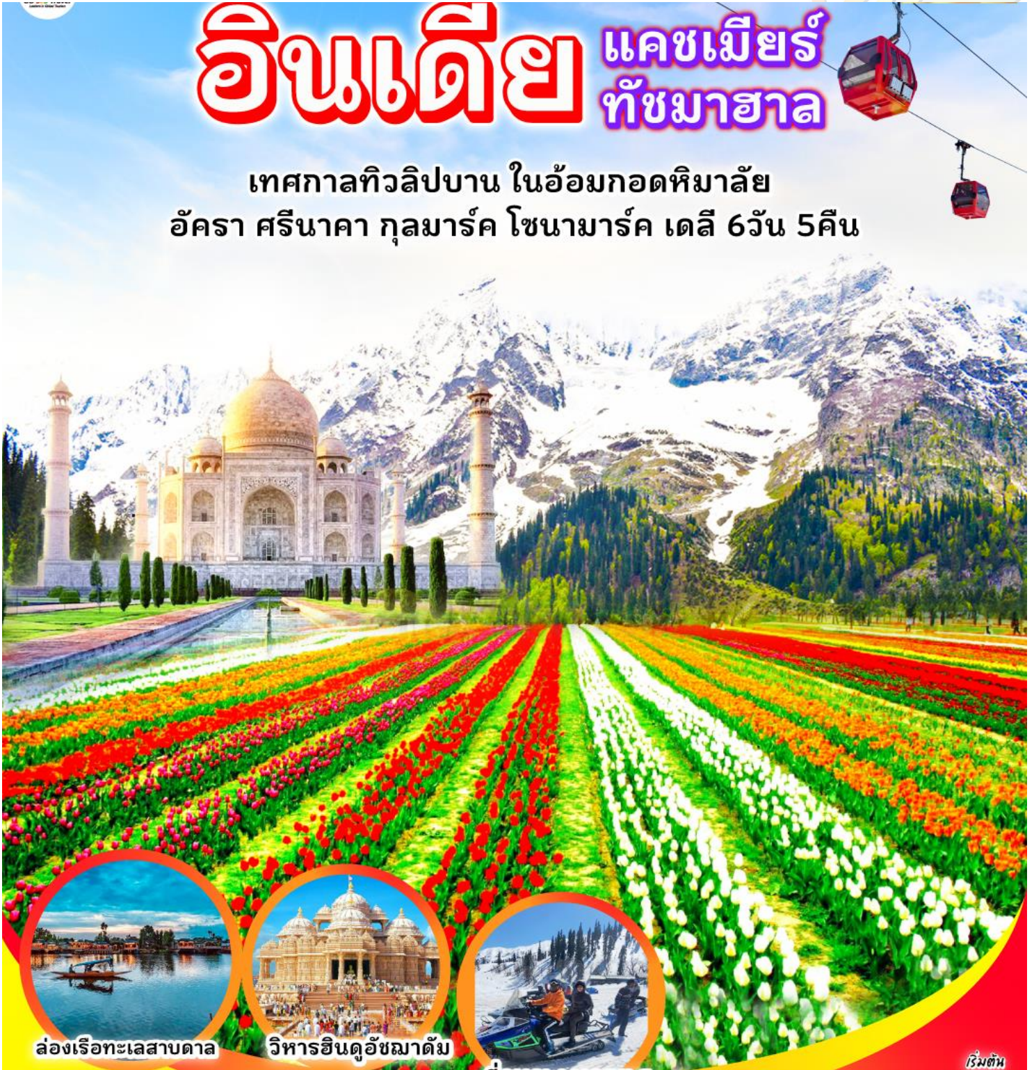
ล่องเรือทะเลสาบตาเล

เทศกาลทิวลิปบาน ในอ้อมกอดหิมาล้ำ อัครา ศรีนาคา กุลมาร์ค โซนามาร์ค เดลี 6วัน 5คืน