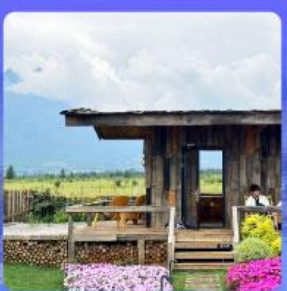
ร้านกาแฟหยุนตัน