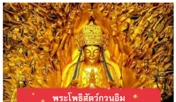
พระโพธิสัตว์กวนอิม

นำท่านเดินทางสู่ มรดกโลกอุทยานผาหินแกะสลักต้าจู๋ ศิลปะหินแกะสลักอันล้ำค่าแห่งเมืองฉงชิ่งมรดกโลกที่องค์การยูเนสโกขึ้นทะเบียนเมื่อปี ค.ศ. 1999 ตั้งอยู่ทางตะวันตกของนครฉงชิ่ง ประเทศจีน ศิลปะหินแกะสลักเหล่านี้สร้างขึ้นตั้งแต่ราชวงศ์ถังจนถึงราชวงศ์ซ่ง มีอายุมากกว่า 1,000 ปีโดดเด่นด้วยงานแกะสลักทางพุทธศาสนาที่งดงามและยังคงสภาพสมบูรณ์ (ใช้เวลาเดินทางประมาณ 1-2 ชั่วโมง)