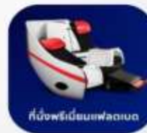
ที่นั่งพรีเอ็มเซฟลดเบด