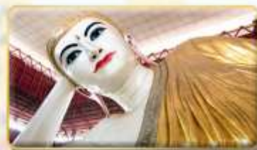
พระนอนคาคาหวาน