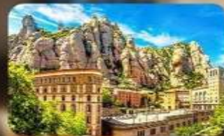
เขามอนต์เซอร์รัต