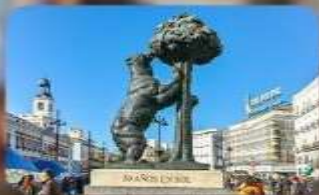
อนุสาวรีย์หมี