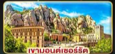
เขามอนต์เซอร์รัต