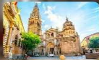
มหาวิทยาลัยโตเลโด