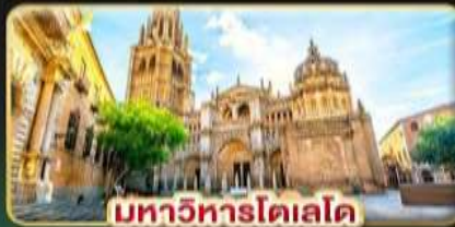
มหาวิหารโคเลโด