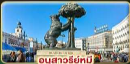
อนุสาวรีย์หมี