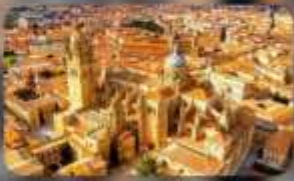
เมืองซาลามังกา