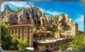
เขามอนต์เซอรัลด์