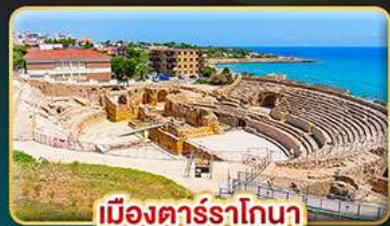
เมืองตาร์ราโกนา

📅เดินทาง : 10-17 เม.ย. | 17-24 เม.ย. 01-08 พ.ค. 69