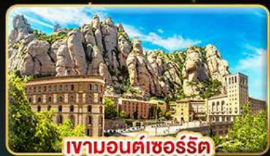
เขามอนต์ซอร์ริต