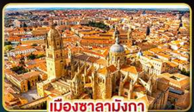
เมืองซาลามังกา