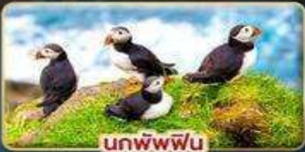
นกพิฟฟิน

📅 เดินทาง : 30 เม.ย. - 07 พ.ค. | 23-30 ก.ค. 69