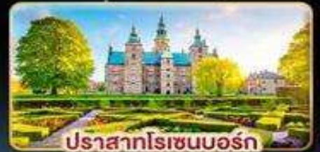
ปราสาทโรเซนบอร์ก